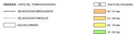
GRAFICO DE DISTRIBUCION DE ZONAS